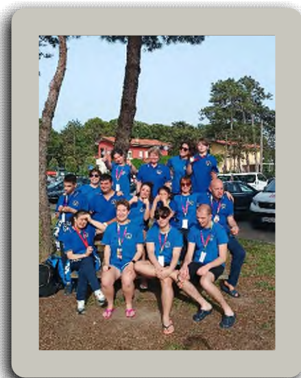
G.S.D. Senior e Junior