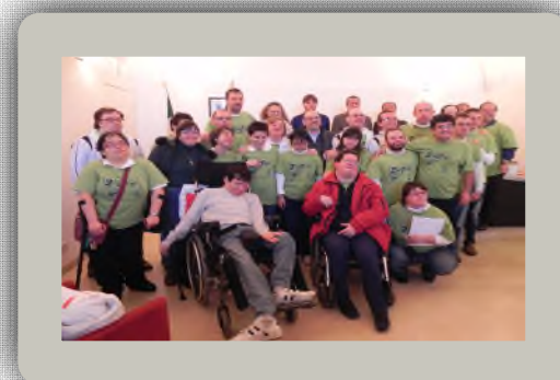
La prima delle numerose premiazioni Comune nel 2011

Acquamarina Team Trieste ASD APS iscritta al R.U.N.T.S. n°45078 Sede legale: Molo F.lli Bandiera, 1 - 34123 Trieste Sede operativa: Via Modiano, 5 - 34149 Trieste Pec: acquamarinaonlus@pec.buffetti.it Email: info@acquamarinateamtrieste.it